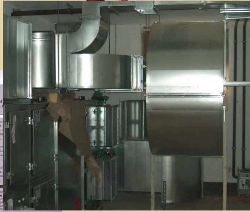
Umgestaltung Jugendhaus OTTO oben: Lüftungsanlage links: Baustelle unten: Modell für Dachreiter

HGT Architekten + Ingenieure Matthias Tränkner Marienmauer 17 • 06618 Naumburg Tel 0 34 45 / 26 68 14 Fax 0 34 45 / 26 68 79 mtraenknermb@t-online.de