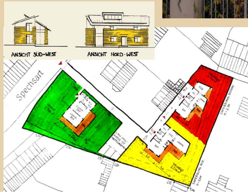
Neubau dreier Zweifamilienhäuser am Spechbart Vorentwurf und Bebauungsvorschlag