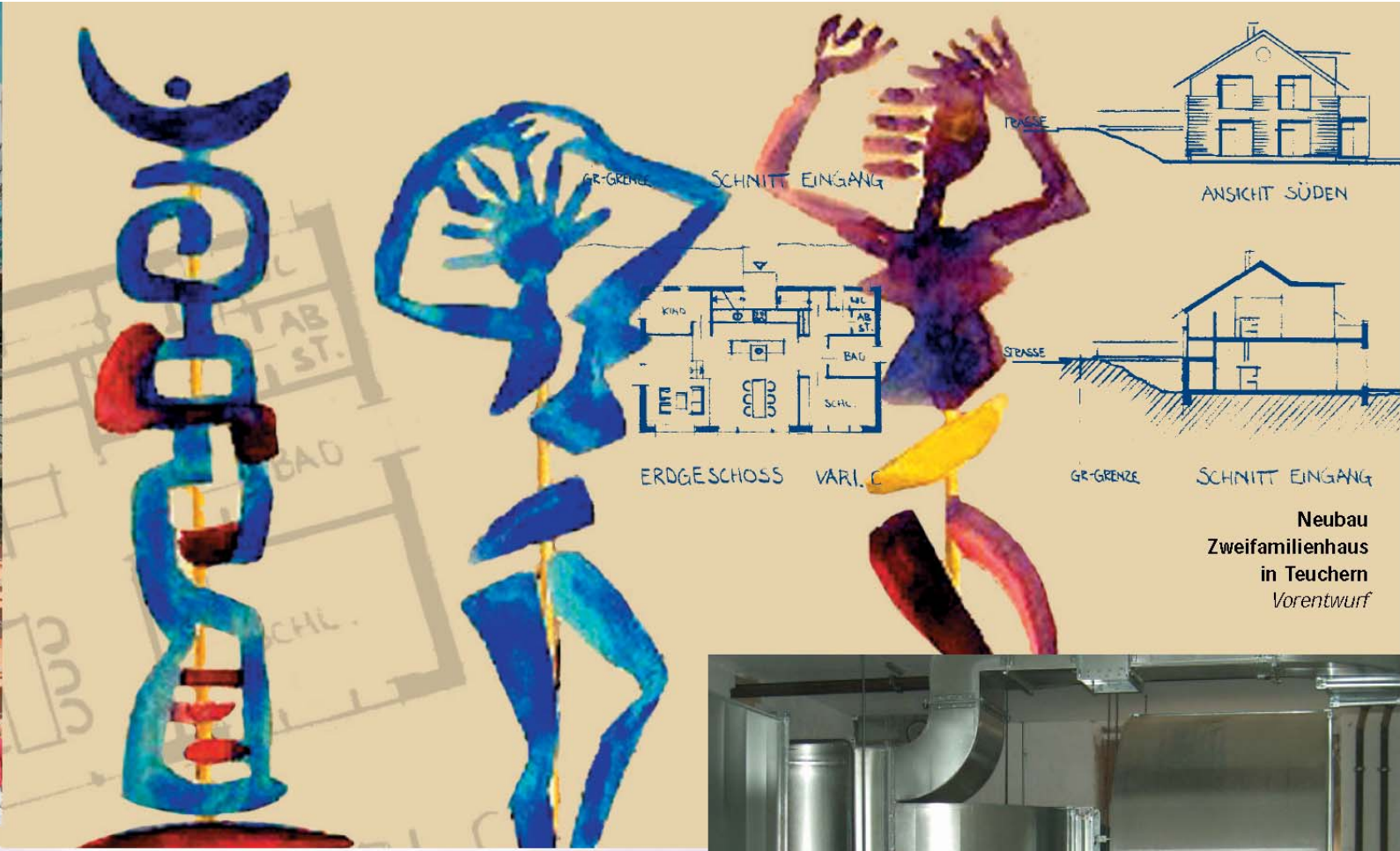
Neubau Zweifamilienhaus in Teuchern Vorentwurf