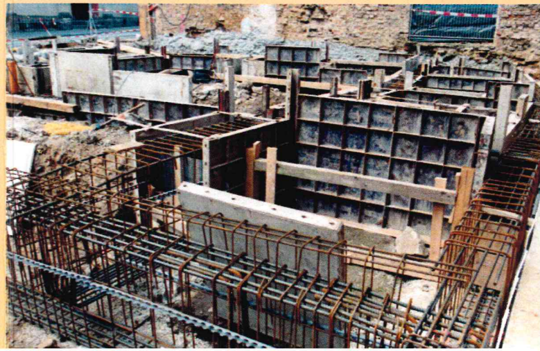
Wohn- und Geschäftshaus, Baubetreuung eines eigenen Entwurfs, Gründungsarbeiten